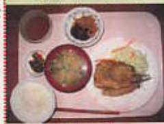
本日のAセット メインは「イワシ梅しほ揚げ」