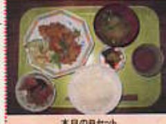
本日のBセット メインは「鶏の唐揚げ酢だれ」