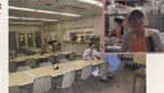
食堂も厨房も調理員さんも全て美しく衛生的です!

病院のすぐそばにある「松阪城跡」は桜の名所として有名です。春になったら食堂でおいしいランチを食べて外で桜を眺めるなんて素敵ですね。